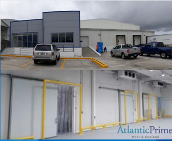
Atlantic Prime La Paz, B.C.S. | 2018

Centro de distribución y conservación de producto percedero cárnico.