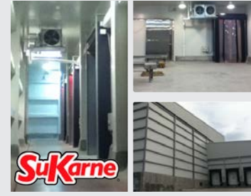
SuKarne Agroindustrial Culiacán, Sinaloa | 2016

Construcción integral de nuevo rastro en etapas: Etapa 1. Frigoríficas y área de logística.