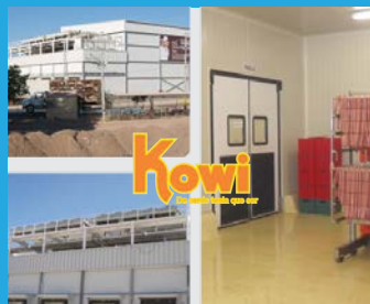
Alimentos Kowi Navojoa, Sonora | 2012

Áreas de proceso, limpieza, bodegas de conservación en media y baja temperatura, andén y oficinas.