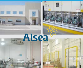
Alsea Hermosillo, Sonora | 2011

Equipos de refrigeración en andén de carga.