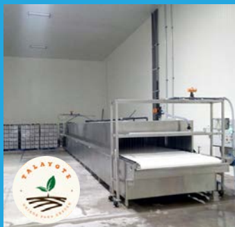
El Talayote SPR de RL Villagrán, Guanajuato | 2018

Suministro e instalación de Hidroenfriado y equipo de refrigeración para conservación de brócoli y espárrago.