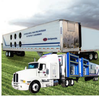
Sistema Móvil de Pre-Enfriado por Aire Forzado

Sistema en paquete listo para operarse, diseñados para una larga vida útil y bajo costo de mantenimiento.