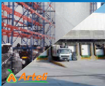
Tienda de Descuento Arteli Altamira, Tamaulipas | 2015

Construcción de nuevo Rastro Tif en año 2006 y construcción de CEDIS en 2013.