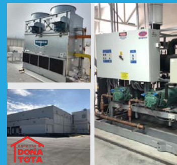
CEDIS Doña Tota Monterrey, N.L. | 2017

Construcción integral de nuevo Centro de Distribución de OXXO Mérida.