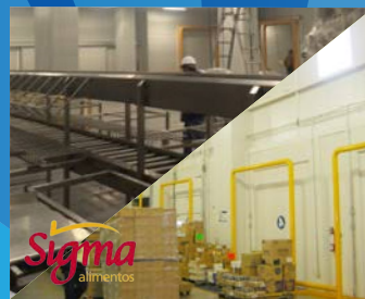
Sigma-Comnor Veracruz | 2014

Instalación de rack de compresores para media-baja temperatura y evaporadores para cámaras, dos congeladores y puertas de andén.