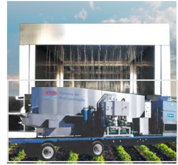
Sistemas de Enfriamiento por Agua Helada (Hidrocooler)

Sistema montado en caja-remolque aislado, práctico traslado al lugar de producción, no requieren inversión en cámaras y equipamientos.