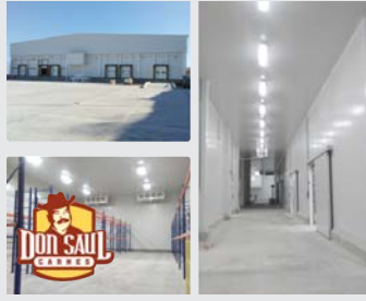
Agropecuaria JS Culiacán, Sinaloa | 2015

Centro de distribución y conservación de producto percedero cárnico.