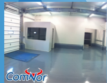
Sigma-Comnor Guadalajara, Jalisco | 2013

Obra civil, panel y refrigeración para cuartos de conservación de congelados, frescos y andén.