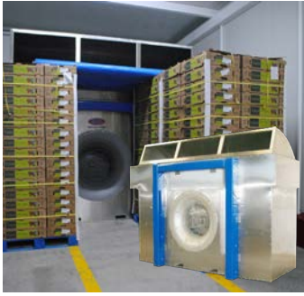
Sistemas de Pre-enfriado por Aire Forzado

Sistema en paquete listo para operarse, diseñados para una larga vida útil y bajo costo de mantenimiento.