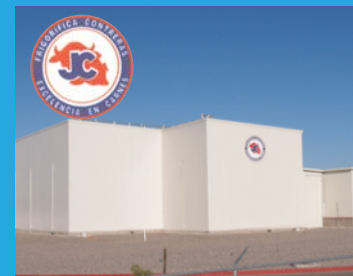
Friconsa Hermosillo, Sonora | 2007

Sistema de refrigeración para cuatro congeladores rápidos de carne, bodega de conservación, congelados, área de andén, canales y área de proceso.